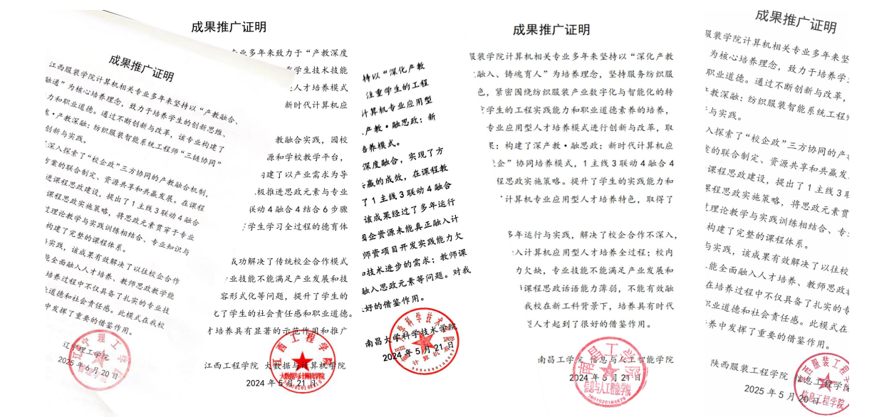
图 7 兄弟院校部分成果推广证明

该模式重构课程体系，学生竞赛获奖量提升 38%，如图 8 所示。“高级工程师实战之路”系列数智微课通过多平台推广，服务社会学员超 130 万人，被 130 余所高校选用。