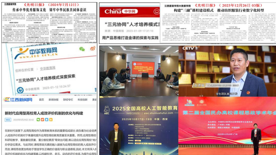
图 8 部分媒体报道相关成果

成果获中国教育电视台、《光明日报》、中华教育网、凤凰网、江西新闻网等多家主流媒体报道，教学团队成员被《纺织服装周刊》、中国服装协会网等专题报道；多次在全省高校计算机院长联席会等会议上作经验分享，相关研究获评优秀理论成果一等奖并纳入汇编推广，为新工科背景下行业应用型高校提供了可复制的“产业适配型数智技术人才培养范式”，示范引领作用显著。如图 9 所示。